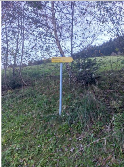
1. Abzweigung von der Straße auf den Fußweg